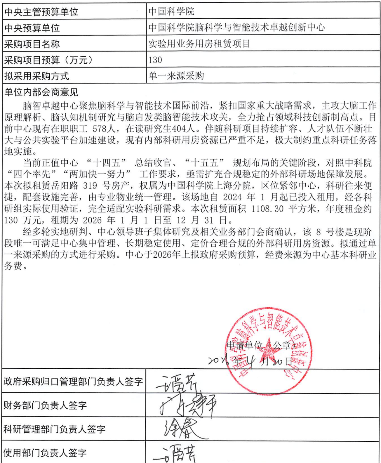
表2 单一来源采购单位内部会商意见表（二）

说明：1. 对采购限额以上公开招标数额标准以下，需要直接采用单一来源采购方式的采购项目，需在采购前填写此表。 2. 此表除使用部门负责人签字外，其他内容均用计算机打印。